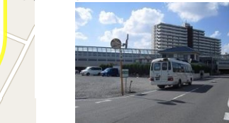
⑮ 袖ヶ浦西小学校向い