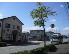
② 秋津小学校歩道橋下