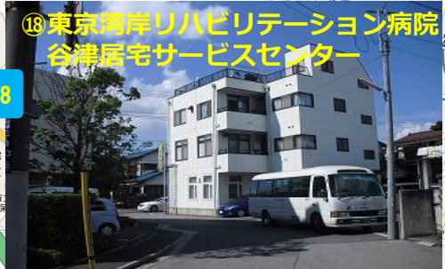
⑱ 東京湾岸リハビリテーション病院 谷津居宅サービスセンター