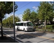
⑥ 香澄1丁目いちご公園