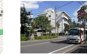
⑫ 袖ヶ浦公民館信号手前